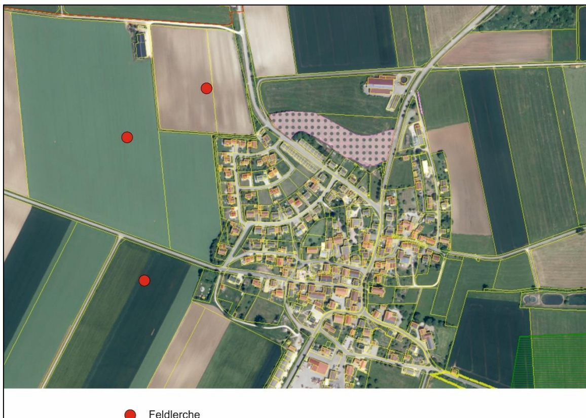
Abb.: Brutzentren der Wiesenbrüter