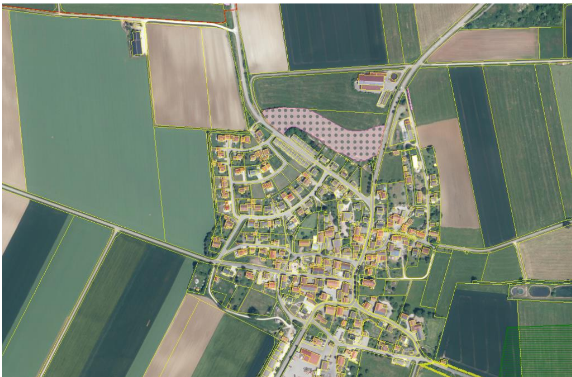
Abb.: Luftbild mit Biotopen (FIS-Natur Oktober 2023)

Die Maßnahme liegt im Naturpark "Altmühltal". Kartierte Biotope sind auf der Fläche und im näheren Umkreis nicht vorhanden. Einträge in der Artenschutzkartierung sind ebenfalls in weitem Umkreis nicht vorhanden.