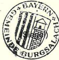
Satzinger Erster Bürgermeister

Ausgehängt an den Bekanntmachungstafeln in allen Ortsteilen der Gemeinde Burgsalach